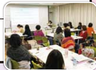
事業計画作成風景